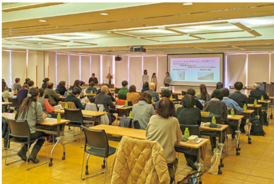
第2回福祉教育推進セミナー

2月10日(月)に第2回福祉教育推進セミナーが開催されました。立山小学校5年生9名が、総合学習を通して学んだテーマ「誰もが過ごしやすい地域へ～ユニバーサルデザイン～」について発表しました。