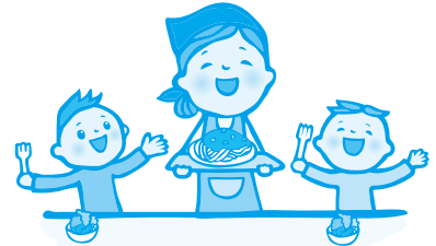
※町社協が連携した取り組み

多世代交流、安心できる場所、にぎわいづくりなどを目的に、下記の団体による食事を伴った『居場所』が運営されています。「参加してみたい。」「運営に協力したい。」など関心のある方は、町社会福祉協議会までお問い合わせください。